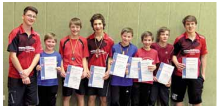
Die Teilnehmer des Jugendwettbewerbs.

Alle oben genannten Spieler und alle Viertplatzierten in der jeweiligen Altersklasse haben sich für die Kreis-Minimeisterschaften in Babensham qualifiziert.