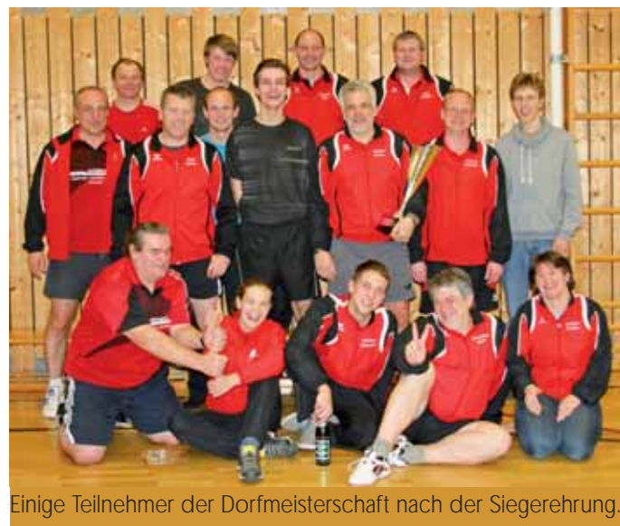
Einige Teilnehmer der Dorfmeisterschaft nach der Siegerehrung.