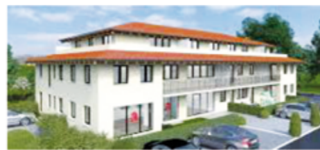
Alpenstraße 25 - 08039 909 63 70 - alpen-apo@web.de

Das Team der Alpen Apotheke wünscht Ihnen frohe Festtage und einen guten Rutsch in das neue Jahr 2022!