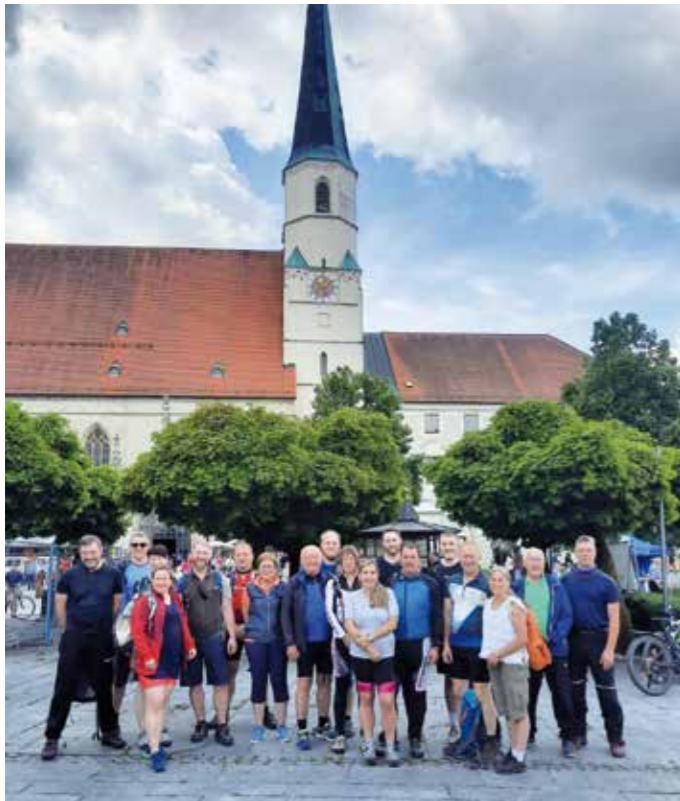
Die Radgruppe des Frauenbundes und der Schützen in Altötting vor der Rückfahrt.

Wie schon seit Jahren, so trafen sich auch am heurigen Pfingstmontag die Frühaufsteher unter den Radlerinnen und Radlern des Frauenbundes und der Schützengesellschaft um 5.30 Uhr an der Volksschule zur Abfahrt nach Altötting. Das Wetter war ideal für diesen Zweck - nicht zu heiß und nicht nass oder kalt. Da lauter ambitionierte Radfahrer:innen dabei waren, kam die Gruppe heuer besonders früh in Altötting an. So konnte man vor Beginn des Festgottesdienstes in der Basilika den Kreislauf noch gut herunterfahren. Die Gemütlichen machten sich nach dem Gottesdienst zum Bräu im Moos auf und ließen sich danach heimbringen. Wenige nahmen es auf sich, die Rückfahrt mit dem Fahrrad auf den zahlreichen Bergaufstrecken anzutreten. Die Hinfahrt mit dem Gefälle ist schon deutlich weniger strapaziös. Auf jeden Fall war diese Wallfahrt wieder ein echt religiös-sportliches Erlebnis.