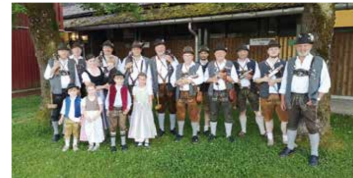
Die Böllerguppe nach dem Frühlingsfestschießen.

Außerhalb des hiesigen Schützengaus ließen es die Böllerschützen beim Großen Böllerschützenreffen in Taxing bei Forstern krachen. Etwa 500 Böllerschützen machten mit ihrem traditionellen Schützengewand und der geübten Handhabung ihrer Handböller und der noch schwereren Schaftböller auf sich aufmerksam. Für Gäste aus anderen Regionen Deutschlands ist dies ein Erlebnis, das auf hundert Handkameras dokumentiert wird und eine Werbung für das wehrhafte bairische Brauchtum ist.