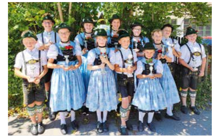
Die Griesstätter Teilnehmer beim Gebietsjugendpreisplattln.