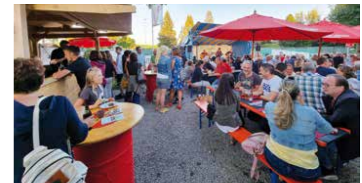
Beste Stimmung bei perfektem Wetter herrschte beim Griabigen Abend des Sportvereins.