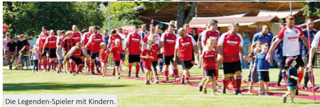
Die Legenden-Spieler mit Kindern.

Lange wurde überlegt und geplant, bevor es „offiziell“ verkündet wurde. Das organisatorisch äußerst aufwendige Abschiedsspiel zu Ehren von vielen alten DJK SV-Fußballern und deren Trainern, die Großteils schon vor Jahren ihre Schuhe an den Nagel gehängt haben oder hängen mussten, konnte tatsächlich stattfinden.