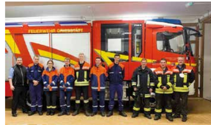
Acht Mitglieder der Griesstätter Feuerwehr bestanden die Prüfung zum Basismodul der Modularen Truppmannausbildung (MTA).

Somit stehen der Griesstätter Feuerwehr und folglich der Griesstätter Bevölkerung nun weitere acht ausgebildete junge Menschen für Einsätze zur Verfügung. Vielen Dank für diese großartige Engagement! Text/ Foto: Florian Seemann