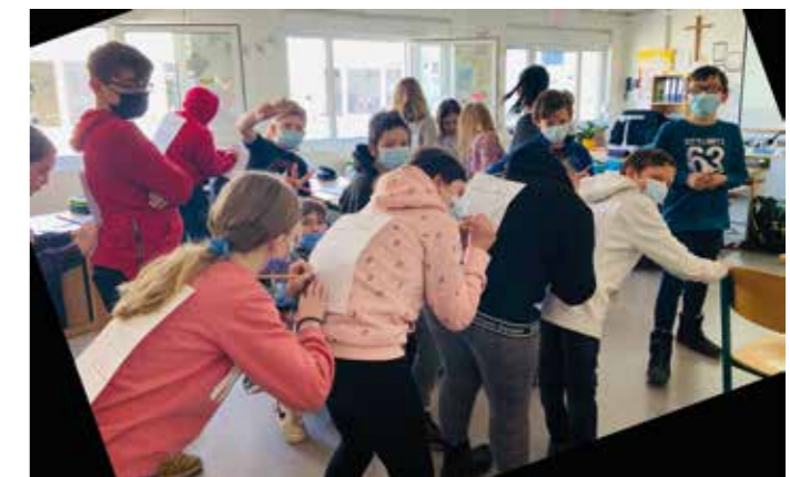
Man schreibt sich gegenseitig nette Worte auf den Rücken.

Mit unterschiedlichen Projekten wird das Gemeinschaftsgefühl gestärkt, Empathie gefördert und auch zum Thema „Anti-Mobbing“ gearbeitet. Text/ Fotos: Magdalena Spießer