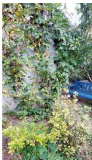
In einem artgerechten Garten findet man Beeren, die auch für Tiere zugänglich sind.

Strukturreich gestaltete Gärten, die dadurch vogelfreundlich sind und dem Artenschutz dienen, bekommen eine Plakette. Der LBV und das Bayerische Artenschutzzentrum des Landesamts für Umwelt haben die bayernweite Aktion „Vogelfreundlicher Garten“ gestartet. Die Auszeichnung ist eine Wertschätzung an alle Gartenbesitzer*innen, die der Natur in ihren privaten Gärten mehr Raum geben und ganz besonders unseren heimischen Gartenvögeln wertvollen Lebensraum bieten. Die Gartenvögel stehen stellvertretend für zahlreiche Tier- und Pflanzenarten, die sich in diesen vielfältigen Gärten ebenfalls wohl fühlen und ideale Lebensbedingungen vorfinden. Es gibt MUSS-Kriterien , d.h. mindestens zwei dieser Punkte sollten erfüllt sein: •Insektenvielfalt •Früchte/Beeren/Samen •Nistmaterial (natürlich/künstlich) • eine wilde Ecke im Garten