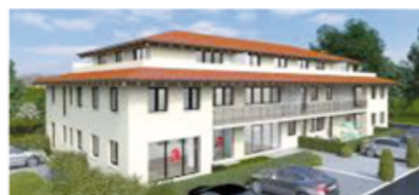
Alpenstraße 25 - Tel: 08039 90 96 370 - alpen-apo@web.de