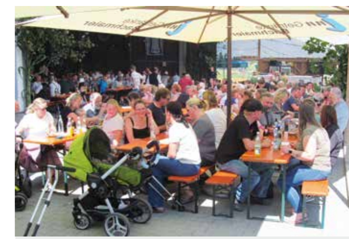
Voll war die Festhalle bereits zum Mittagstisch.

Eine gute Stimmung herrschte auch am Sonntagabend in der Festhalle bei guten Getränken und Burger- und Grillspezialitäten. Abgeschlossen wurde das Fest mit einem