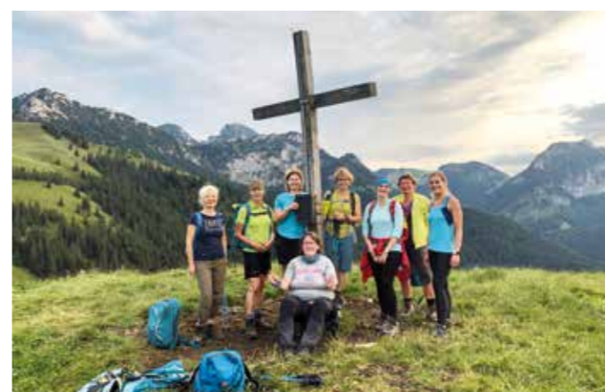
Zum Saisonabschluss unternahmen die Aerobic-Damen abends eine Bergtour auf den Mitterberg bei der Schuhbräualm. Text/ Foto: Hilde Fuchs