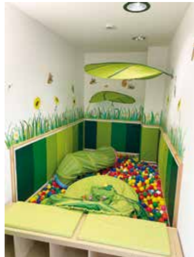
Früher der Tresorraum - heute ein Bällebad.

Die Gesamtfläche der Kinderkrippe umfasst etwa 130 m 2 mit folgenden Räumen: Spielraum, Essensraum, Ruheraum mit Klimaanlage, Bad mit WC, Bällebad, Spielhaus und Wickelbereich. Das Haus beheimatet zwölf Kinder und vier Betreuer*innen.