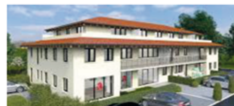
Alpenstraße 25, Tel: 08039 - 90 96 370, alpen-apo@web.de

Wir freuen uns über Ihre Bewerbung an jpheid1@gmail.com