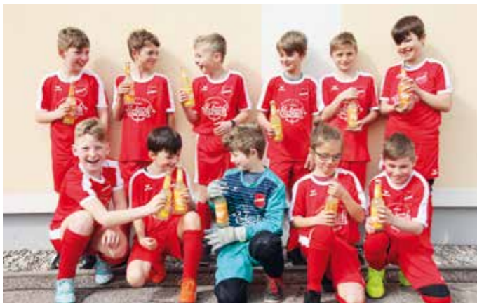
Die E-Jugend beim Spiel in Soyer nach Erhalt des neuen Trikots.

Text: Christoph Bauer; Foto: Veronika Kurzrock