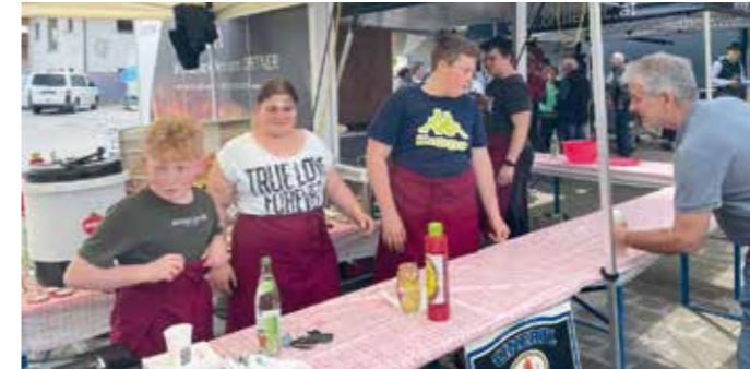
Die jungen Helfer des Schützenvereins beim „Tag der offenen Tür“ der Fa. Ofenbau Liedl“.

Am 5. und 6. Mai fand bei der Fa. Ofenbau Liedl ein Tag der offenen Tür statt. Die Schützen halfen beim Grillen und der Bewirtung der Gäste und durften dafür die Einnahmen als Spende für die Vereinsarbeit behalten. Die Tochter des Firmeninhabers ist begeisterte Schützin; auch der Großvater und Urgroßvater waren im Verein recht aktiv.